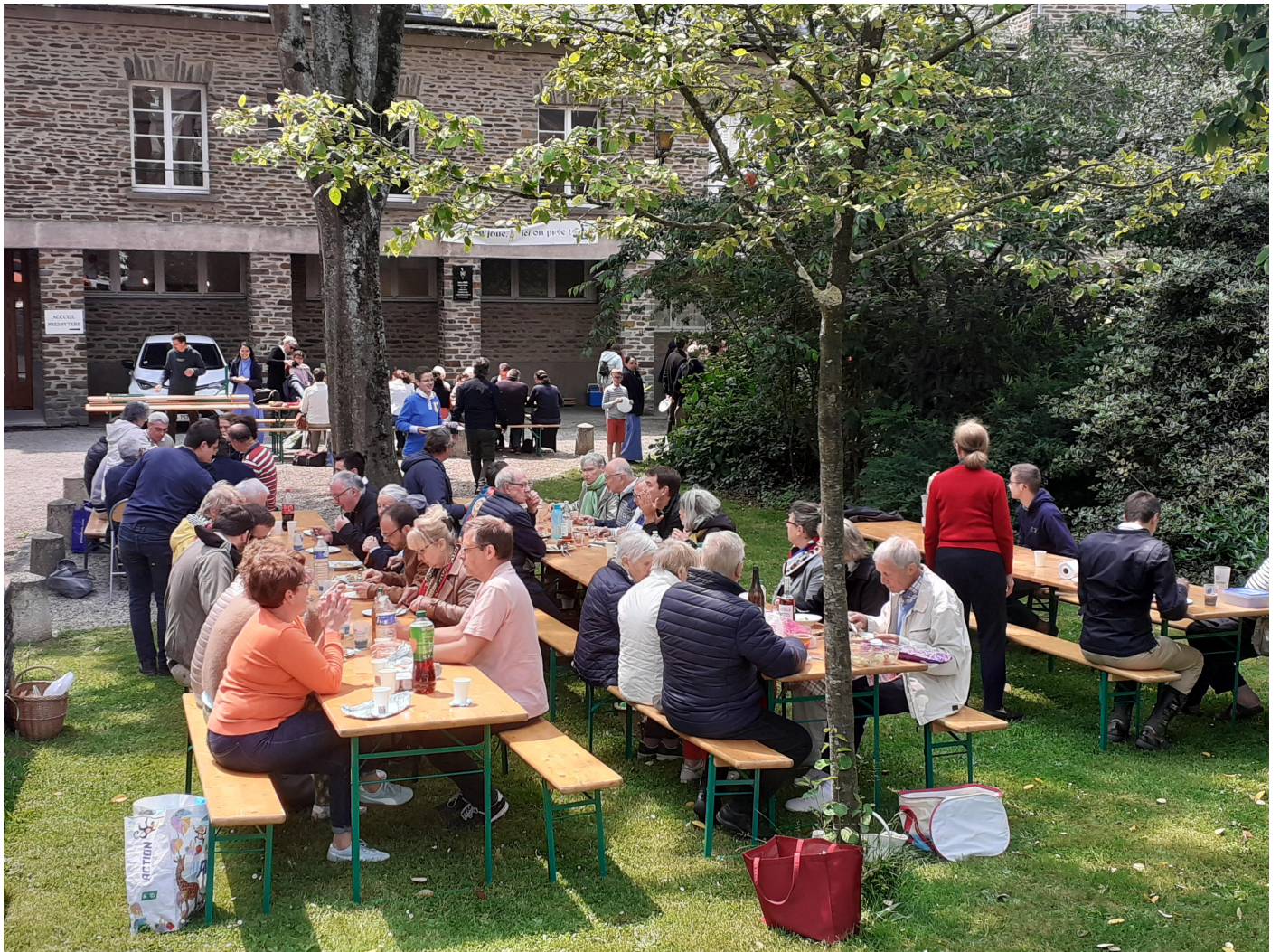
Lundi 9 Juin - Consécration au cœur de Marie