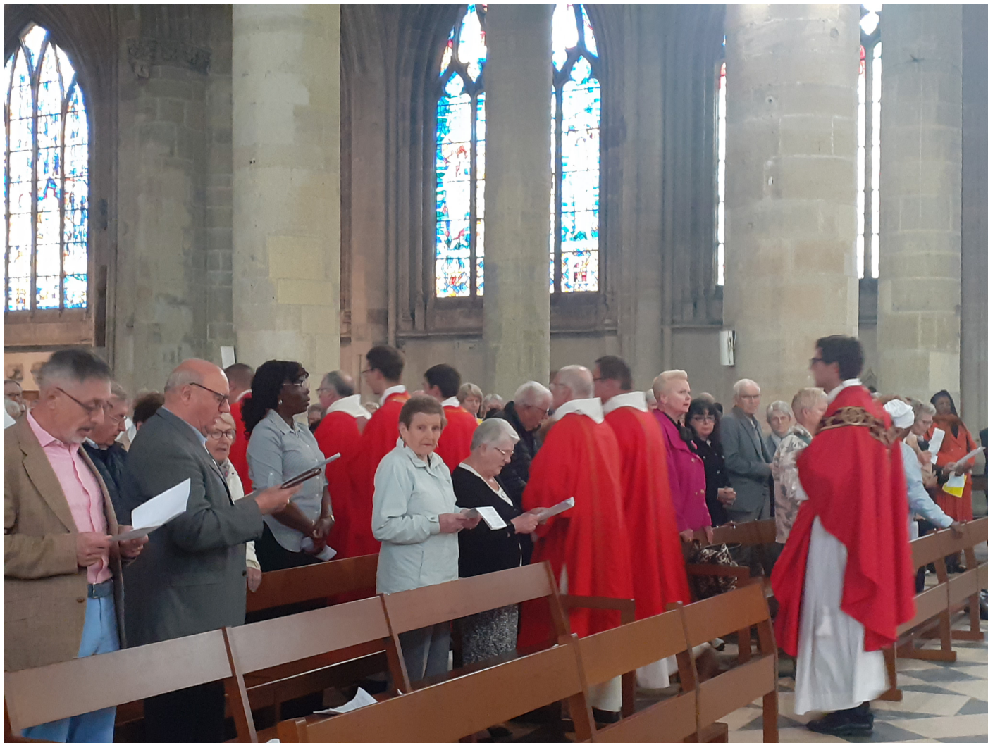
Suivi du repas partagé