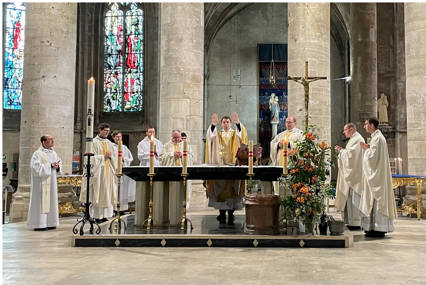
Dimanche 8 Juin - Messe