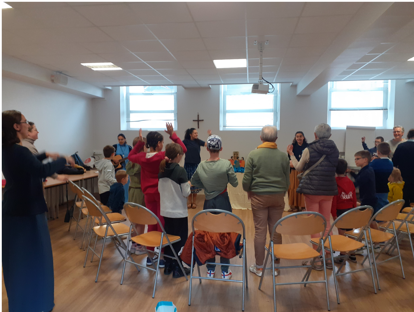
Mercredi 4 Juin - Laudes Notre-Dame