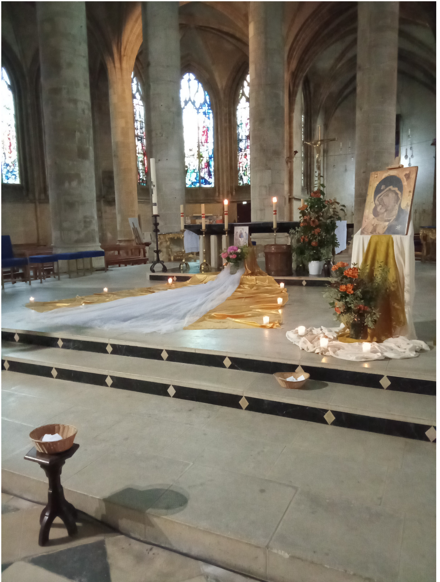
Vendredi 6 Juin - Veillée Sacrement du pardon