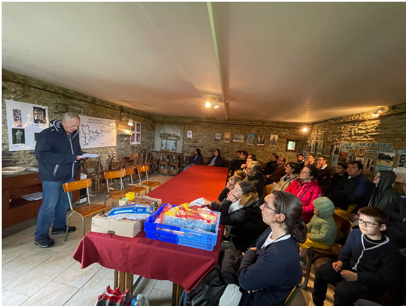
suivi de l'Orgue et de la Messe