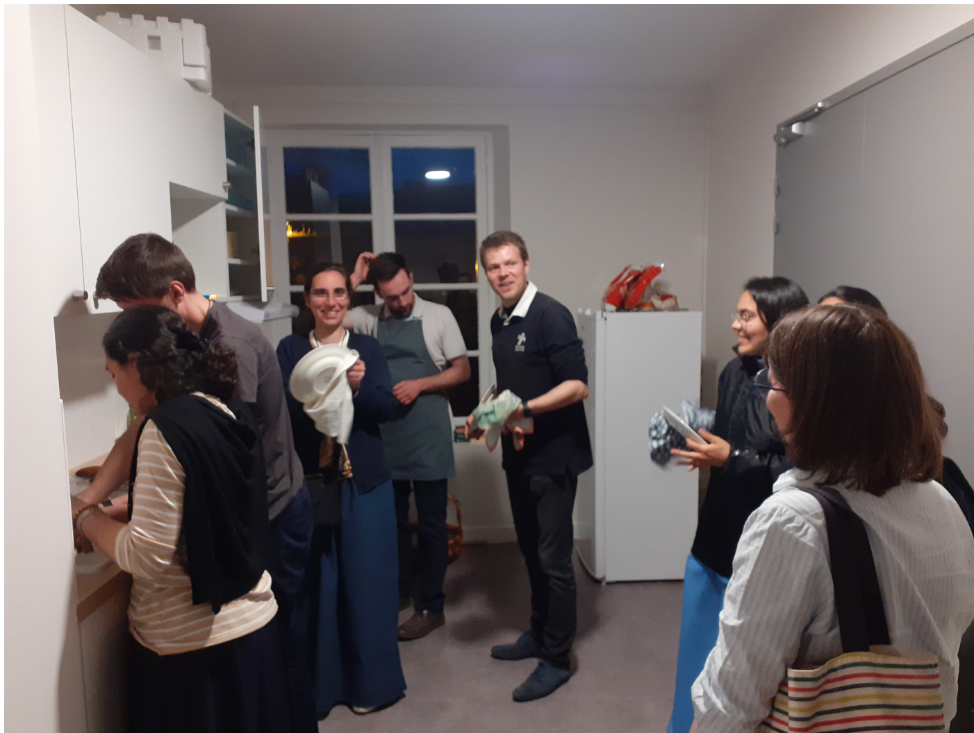
Jeudi 5 Juin - Soirée Louange